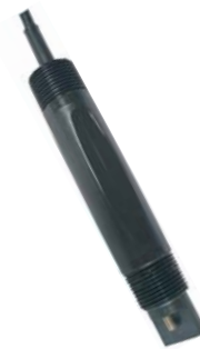
[ Model : 1407 ]