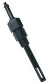
[ Model : 1403 ]